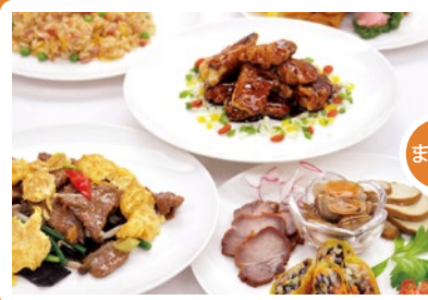
【夕食】中華・彩(いろいろ)コース