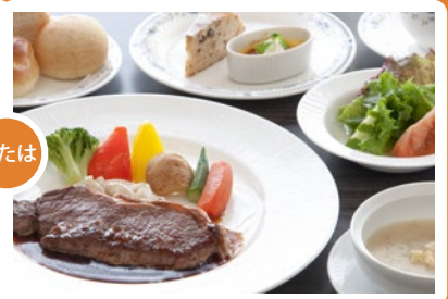
【夕食】洋食・牛ステーキコース