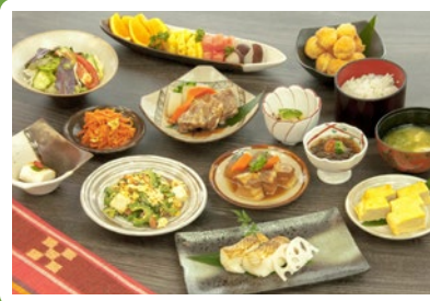
【朝食】和琉朝食ビュッフェ