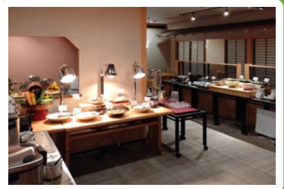
【朝食会場】かたばみ