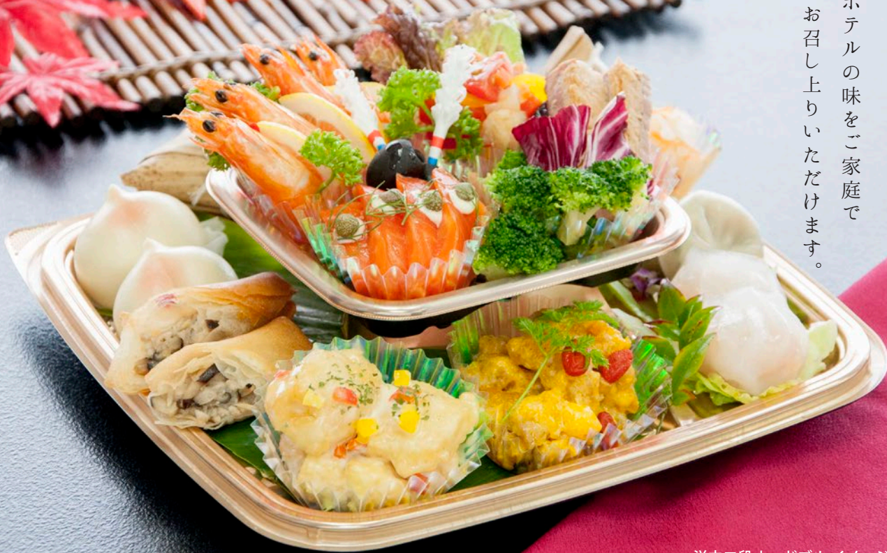
洋中二段オードブルイメージ